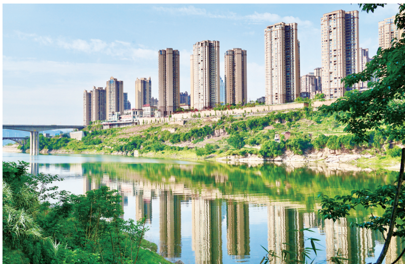
清澈的龙河穿行流经丰都县城

初春时节,温暖的阳光照射在龙河上,平静的河面泛起点点亮光,清澈的河水如一条晶莹的丝带环绕着丰都县龙河镇洞桩坪村。