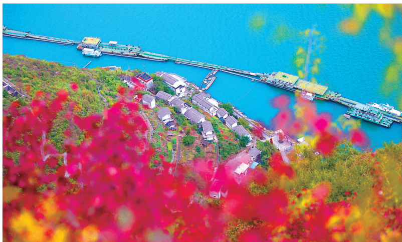
巫山县神女景区的红叶带火乡村旅游。