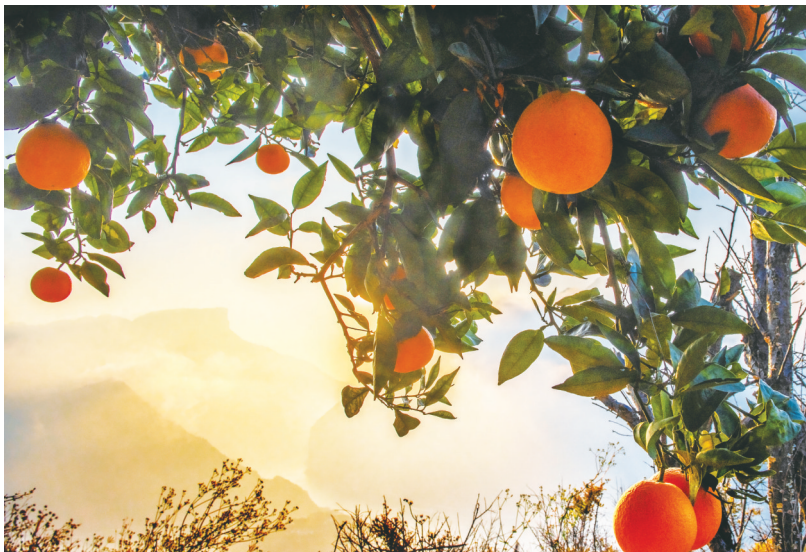
夔门脐橙熟透了。

近年来,草堂镇不断对果园进行智能化改造,不少基地中都能看到各式各样的传感器和摄像头,它们负责实时监控果园的温度、湿度、风速、土壤温湿度和降雨量等数据,然后将数据传回“云端”,进行大数据分析,指