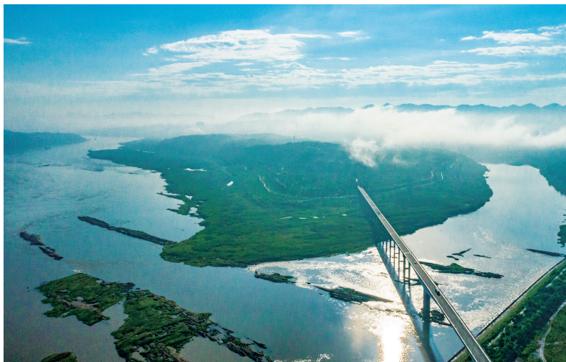
俯瞰广阳岛。

春回大地,在铜锣山、明月山之间,蛰伏了一个冬季的生机又重新回到由长江水滋养的一片江心沃土中。