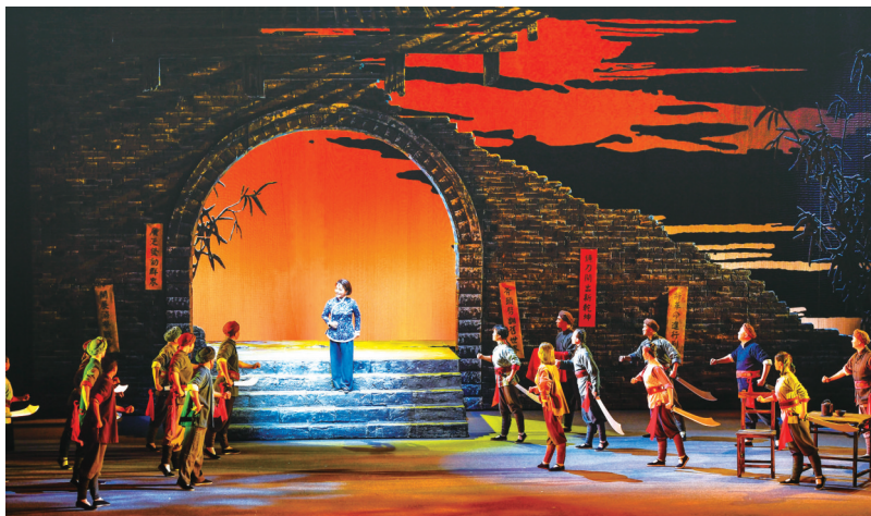
川剧《江姐》剧照。