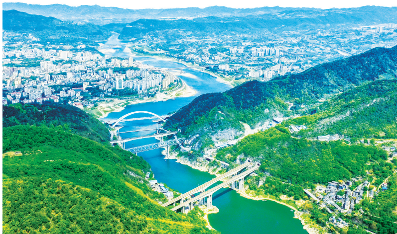
北碚区八桥叠翠生态示范林区春意盎然

数读 截至2022年底,重庆市森林覆盖率达55.04%,森林蓄积量增加到2.61亿立方米,林业及相关产业增加值占全市GDP比重5%以上,高质量推进“两岸青山·千里林带”建设82万亩,签约落地国家储备林项目415万亩。