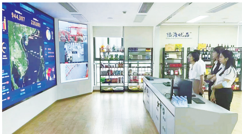
重庆银行走访推动全国首笔西部陆海新通道纯线上信用产品“通道e融”落地

运输2万标箱,同比增长43%……今年前两个月,重庆经西部陆海新通道的发运货物量实现“开门红”。