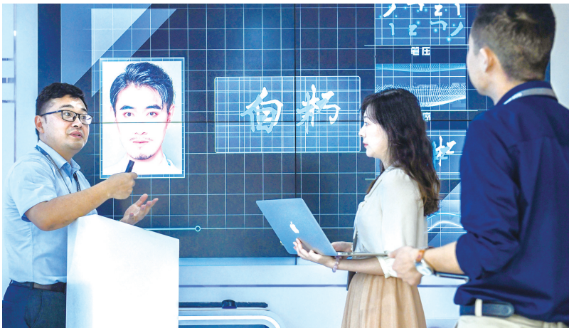
重庆傲雄在线信息技术有限公司的研发人员正在研讨AI笔迹算法识别技术。