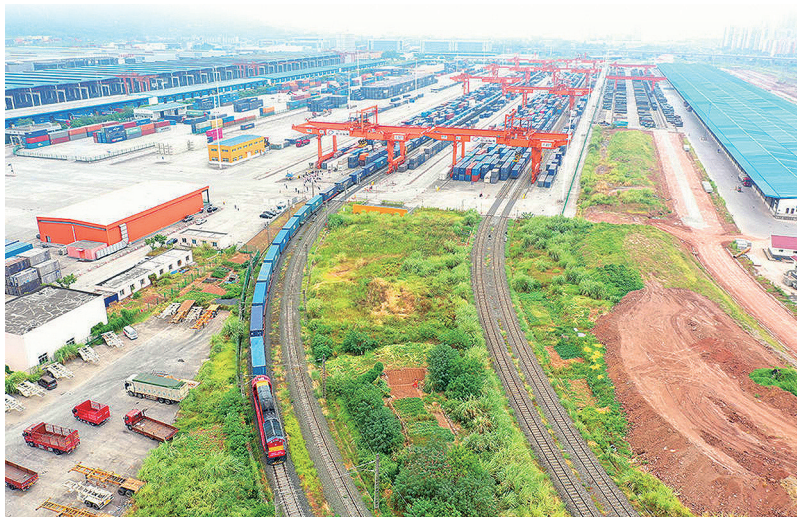
行驶中的中欧班列。