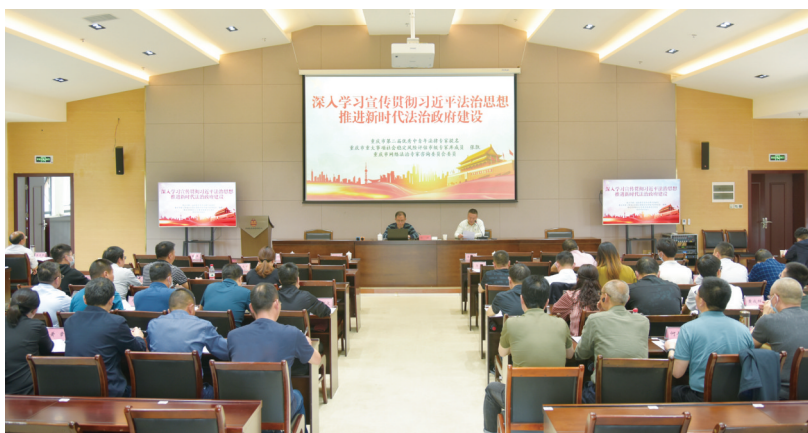
荣昌区开展领导干部法治培训课