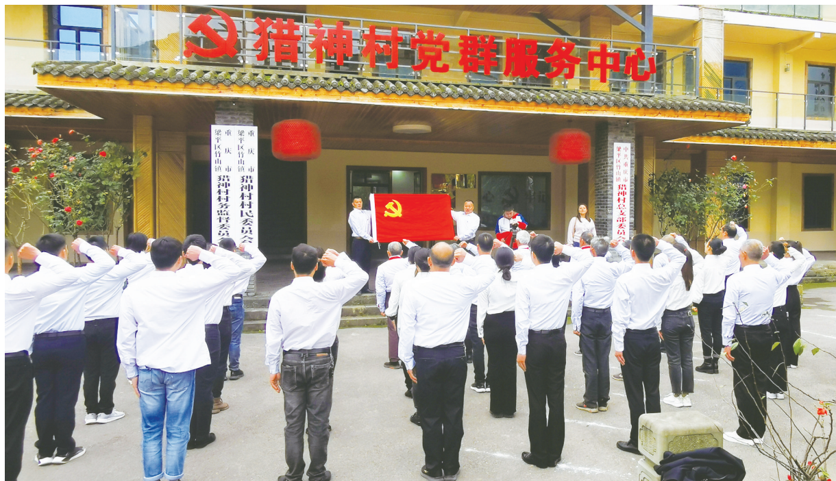
2022年11月3日,猎神村党员干部录制视频《我宣誓》,学习宣传贯彻党的二十大精神